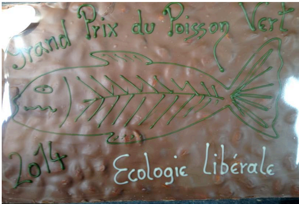
Photo du trophée